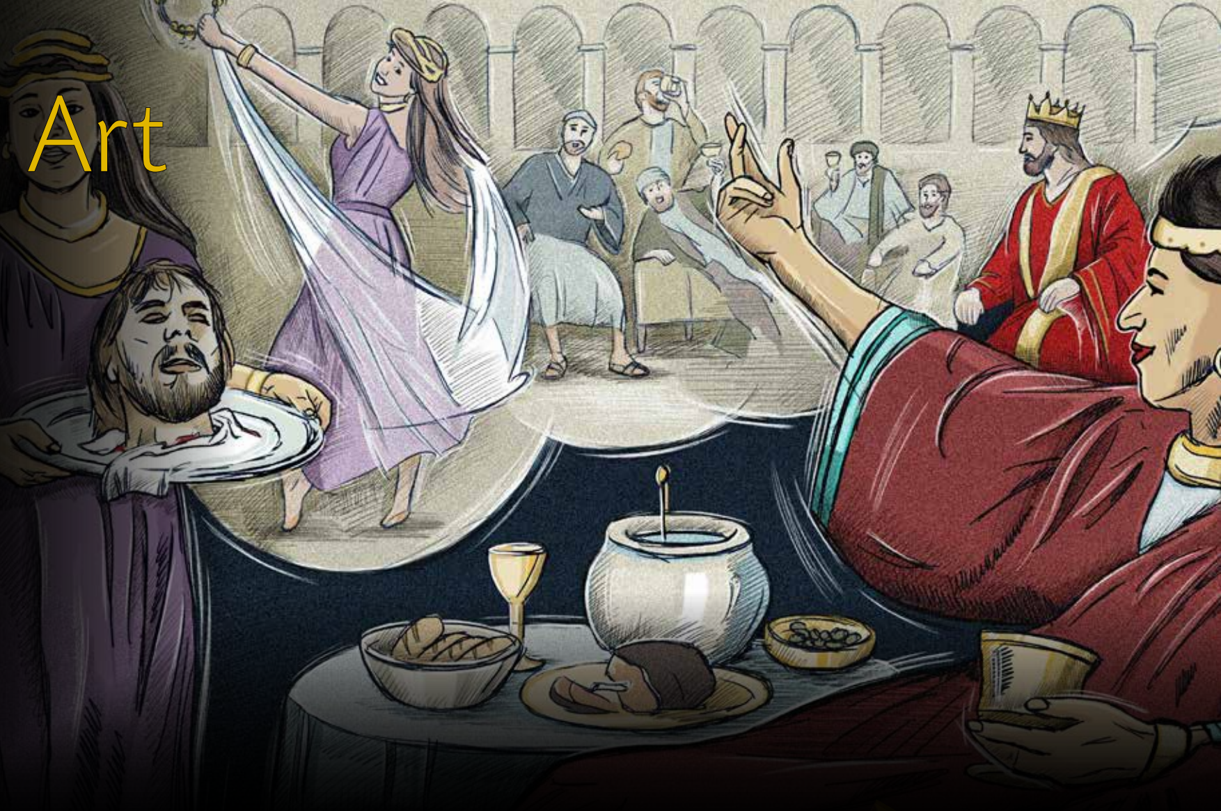
Beispiellose Brutalität: Auf einem Silbertablett wird den Gästen des Geburtstagsfestes von König Herodes der Kopf des hingerichteten Propheten Johannes dem Täufer präsentiert.

ner. Er hat offen angeprangert, dass der russische Präsident Wladimir Putin sich masslos bereichert und wie viele andere Oligarchen das eigene Volk bestiehlt. Nawalny hat dafür mit seinem Leben bezahlt. Er wurde vergiftet, hat knapp überlebt, ist in seine Heimat zurückgekehrt und im Gefängnis zu Tode gebracht worden. Die Geschichte von Johannes dem Täufer ist aktueller denn je.