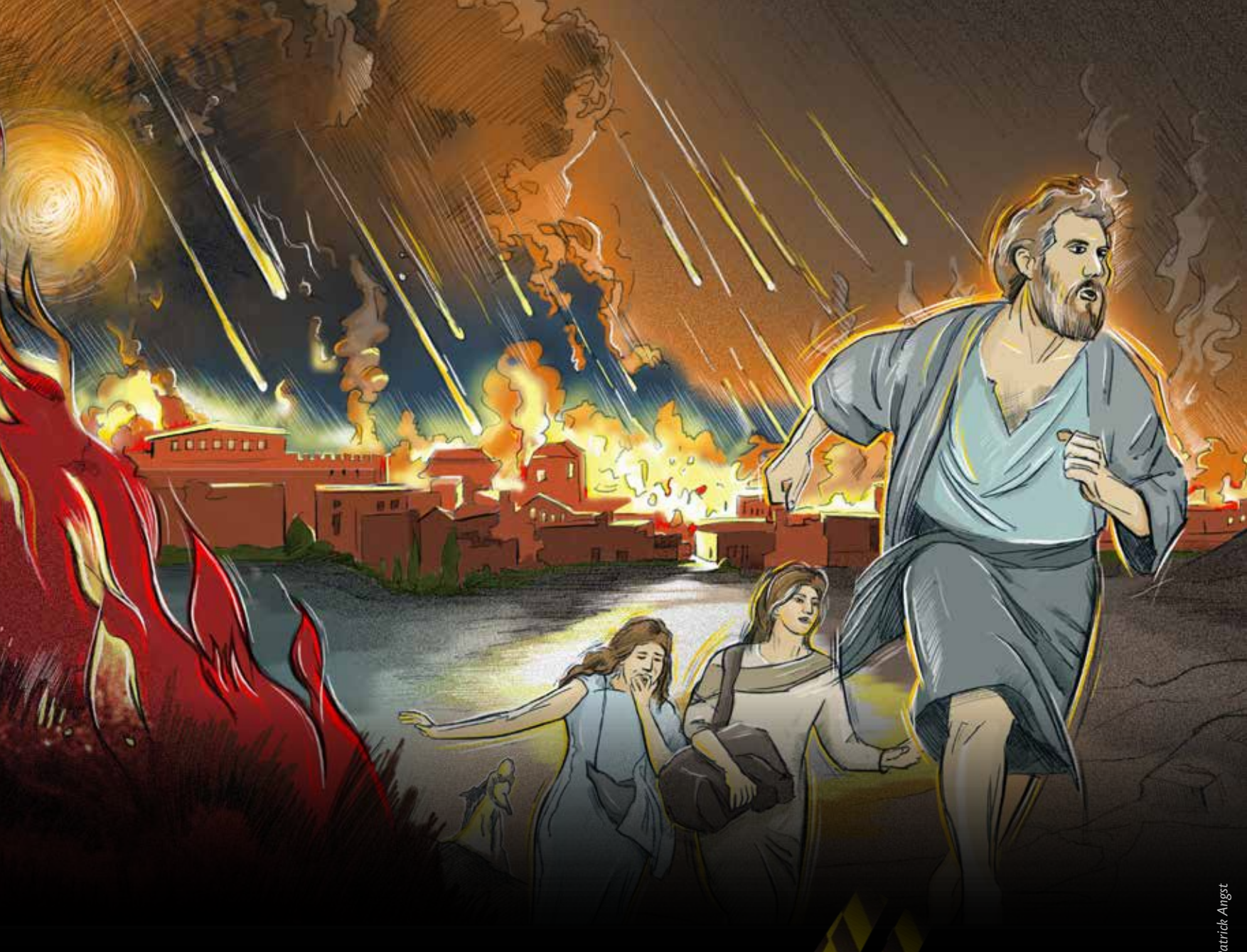
Nicht die ganze Familie überlebt die Flucht: Lots Frau dreht sich entgegen der Anweisung des Engels um und wird zur Salzsäule.